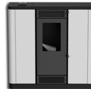
WHITE / IVORY RAL9003 / RAL1015