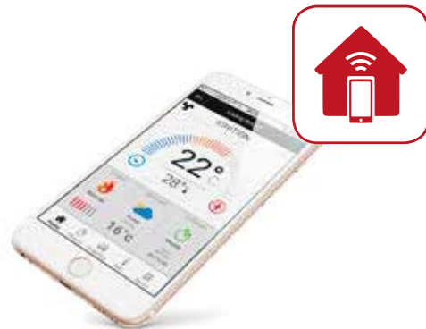
REMOTE MANAGEMENT SYSTEM