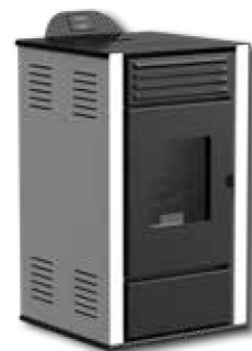
WHITE / IVORY RAL9003 / RAL1015