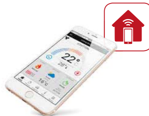
REMOTE MANAGEMENT SYSTEM