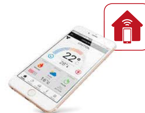
REMOTE MANAGEMENT SYSTEM